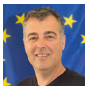
Pela Comissão Europeia

Além disso, o CEE exprime aqui toda a sua solidariedade para com os nossos colegas de trabalho na Ucrânia e particularmente com as três centenas de pessoas que vivem nas regiões de guerra.